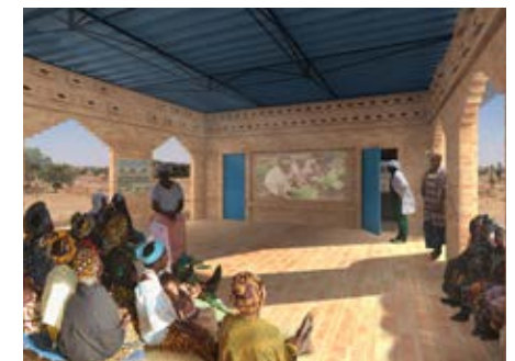
Visualisatie van de ontmoetingsplaats