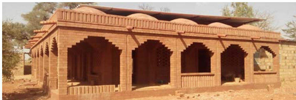
De uitbreiding van van het gemeentehuis is voltooid