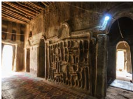
Interieur van de moskee in Nando