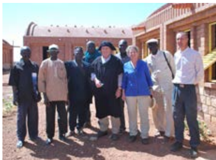
Bezoek aan het Lyceum