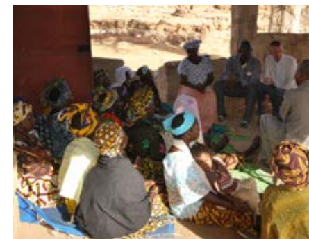
Vrouwengroep in Bongo