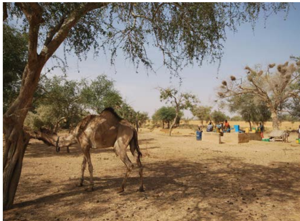
Blauwe Pomp in Tanauan Ibi