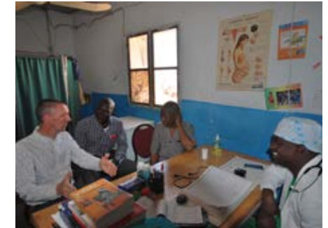
Bijeenkomst met de de lokale dokter