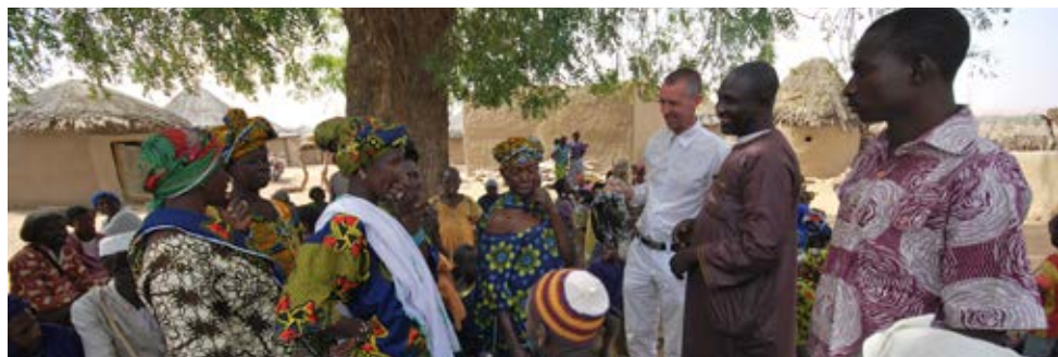
Bijeenkomst met het dorp