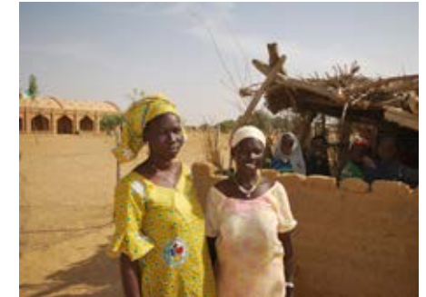
De leraren van de basisschool Tanouan Ibi