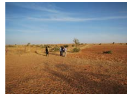
De nabijheid van de Bosquet maakt het mogelijk om het grond te bewerken