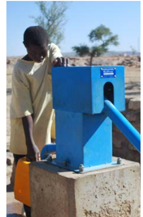
Blauwe Pomp in Sangha