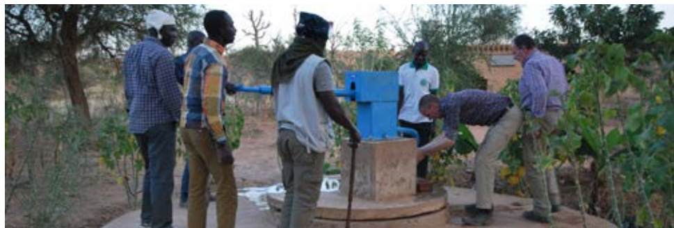
Blauwe Pomp in Koundou

Reclame voor de blauwe Pomp. Het probleem was een ondeugdelijke mof die de verbinding vormt tussen de PVC buizen waardoor het water omhoog komt. De mof was gebarsten en de waterkolom lekte weg.