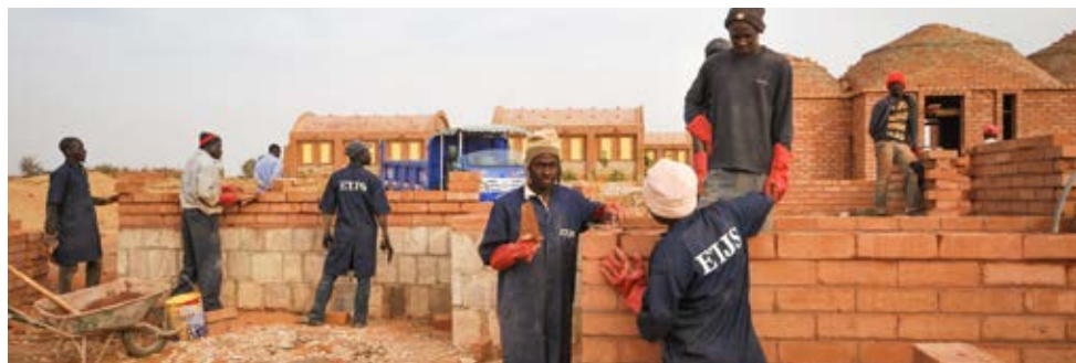
Stagiaire van de École Technique S. José van Sevaré werken aan de voltooiing van het Lyceum