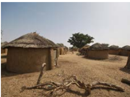
Peul dorp van Boubou