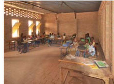
Les Mots Imprimés in Ogoudengou