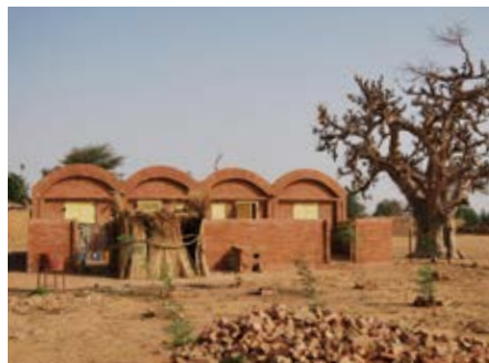
Leraren woningen zijn afgewerkt