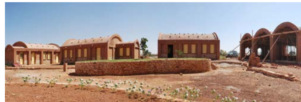
Uitzicht op de klaslokalen en het atelier omringd door de tuin