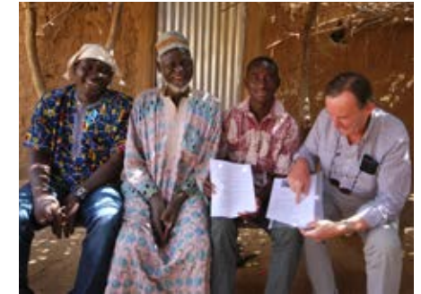
Het contract getekend bij het hoofd van het dorp

Inmiddels is pomp 8 geplaatst in Temagolo en nr. 9 zal binnenkort geplaatst worden in Djangoudia. Het dorp Boré staat op de wachtlijst.