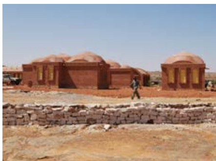
Kantoorgebouwen en de perimeter muur