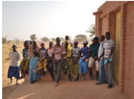
Directeur met studenten en ADI-leden