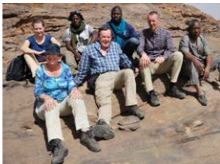
Mission februari 2016