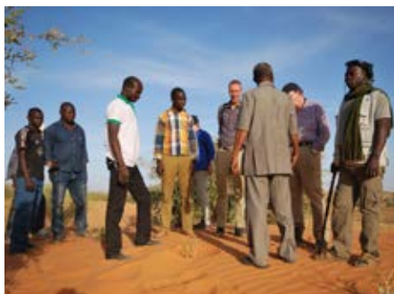
Bezoek op de site van Green Desert Initiative