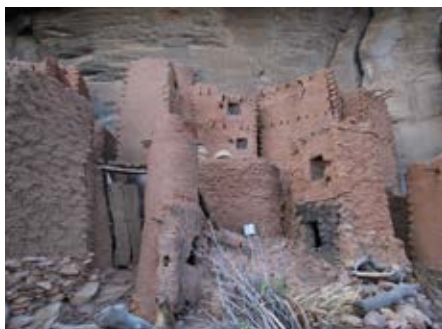
Volgende restauratie in Yendouma Ato