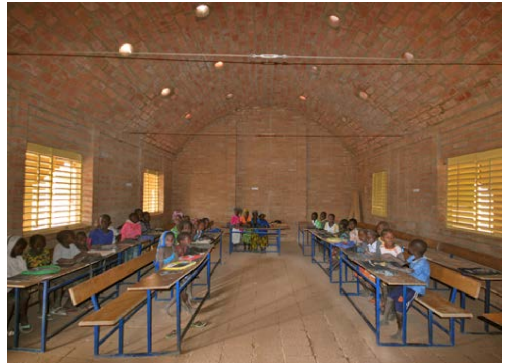
Aanpak van het onderwijs Les Mots Imprimés in Tanouan Ibi