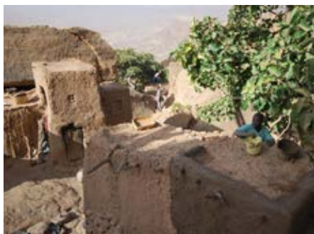
Restauratie van de huizen in Yougo