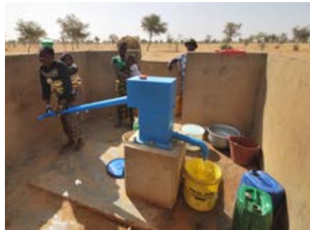
Een van de twee blauwe pompen in Tanouan Ibi