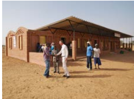
Bijeenkomst met de de directeur van de school

In Tanouan Ibi was het een verrassing om te zien dat ze nog steeds de oude school gebruikten. De nieuwe school werd gereserveerd voor de kinderen van het derde tot vijfde jaar terwijl de oude school voor de kinderen van de eerste twee jaren was bedoeld.