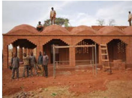
Team van de metselaars

De uitbreiding van het gemeentehuis in Sangha is ook gereed. In de vergaderkamer die door een grote veranda wordt omgeven, zullen de bijeenkomsten plaatsvinden van alle buurtschappen en communities in Sangha dat bestaat uit 37 dorpen met 40.000 inwoners. Het gemeentehuis is een ruimte waar de democratisch gekozen burgemeester en de dorpschoude van elk dorp kunnen samenkomen om besluiten te nemen over de vormgeving van de toekomst van de plaatselijke gemeenschap, inclusief scholen, duurzame water oplossingen, nieuwe wegen en landbouw, maar ook kunnen praten over politieke zaken zoals dreigende conflicten. In ieder dorp worden de beslissingen voor de kleine gemeenschap genomen in de “toguna”. Omdat de grootte van de gemeenschap gerelateerd is aan de capaciteit van het gebouw zou het nieuwe gemeentehuis aan grote “toguna” moeten worden waar zo’n 150 afgevaardigden elkaar ontmoeten en naar elkaar luisteren.