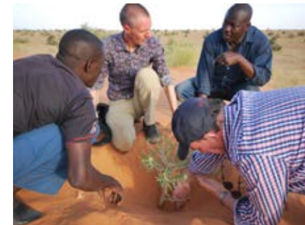
Fixatie van de duinen