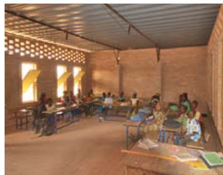
School in Gangouroubourou