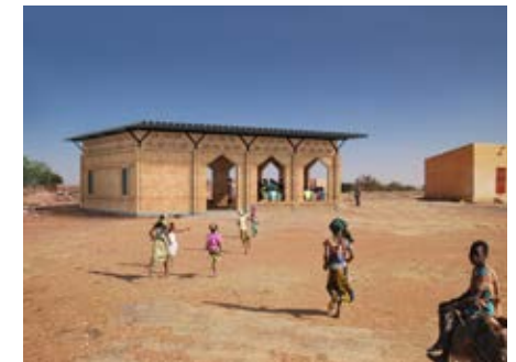
Visualisatie van het gebouw aan de buitenkant