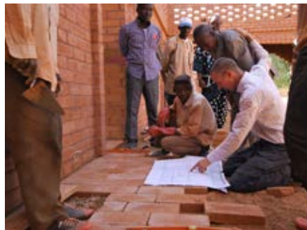
Bezoek op de bouwplaats